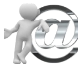
ENVIAR POR EMAIL